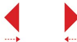
Předepsané proplutí mezi červenými body