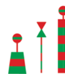
Plavba možná z obou stran (obeplutí ostrova, mělčiny)